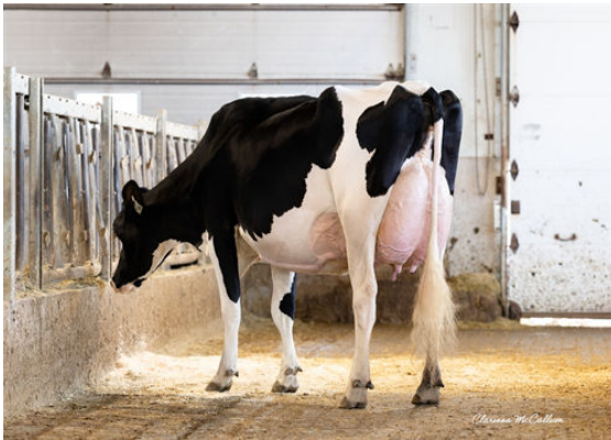
PROGENESIS LARSON KELLEY DAM